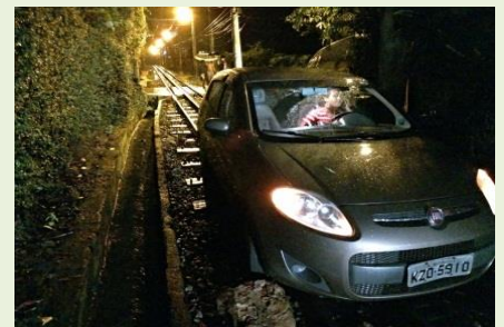
Acima, motorista trapalhão invadiu a linha em cremalheira do trem do Corcovado.